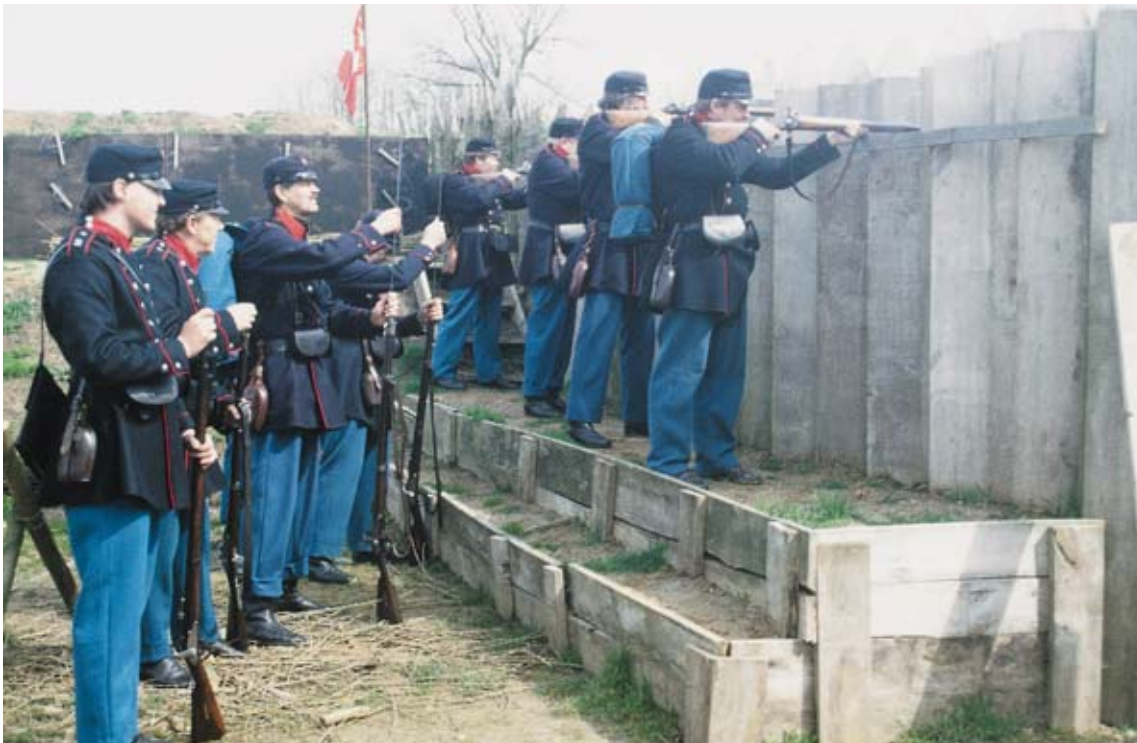
Historiecenter Dybbøl Banke.