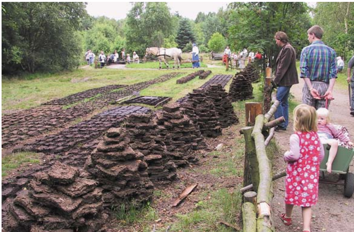
Hjerl Hedes Frilandsmuseum.

Under administrationsomkostninger indgår varetagelse af opgaver i forbindelse med administrationen af den uhævede feriegodtgørelse, herunder: