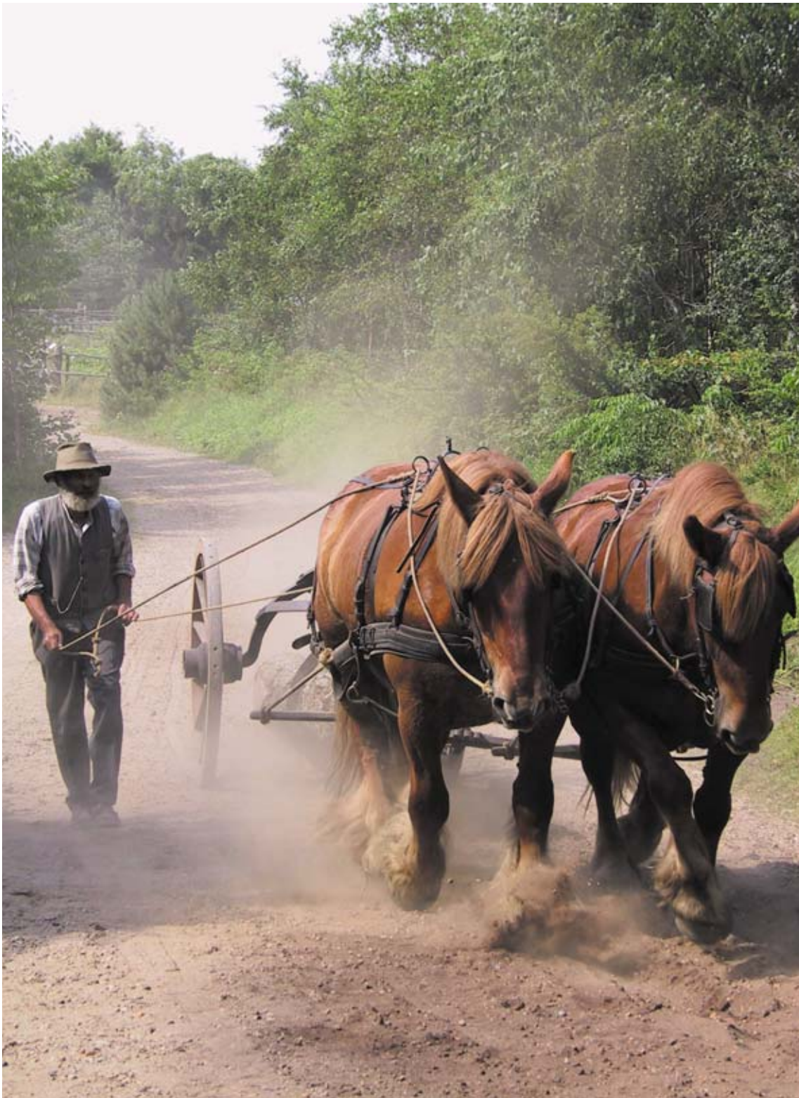
Hjerl Hedes Frilandsmuseum.