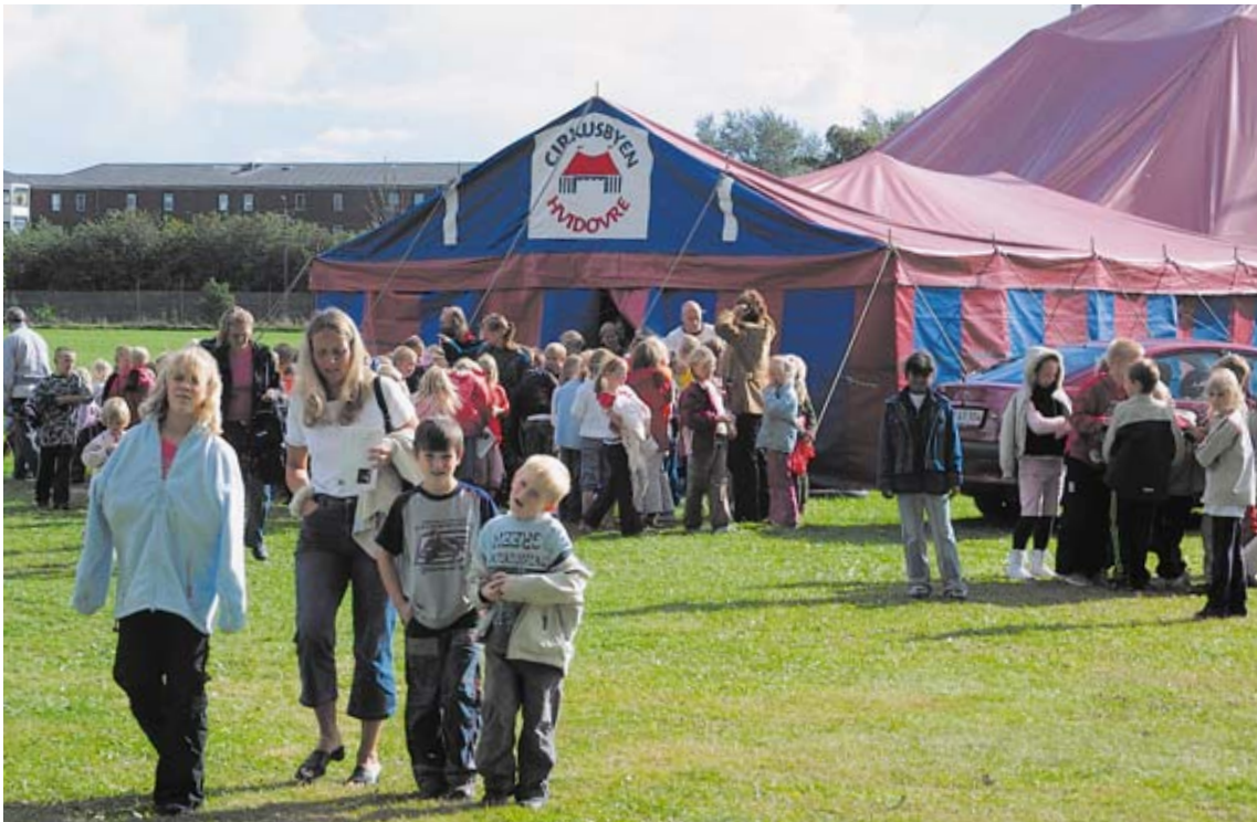
Cirkusbyen i Hvidovre.