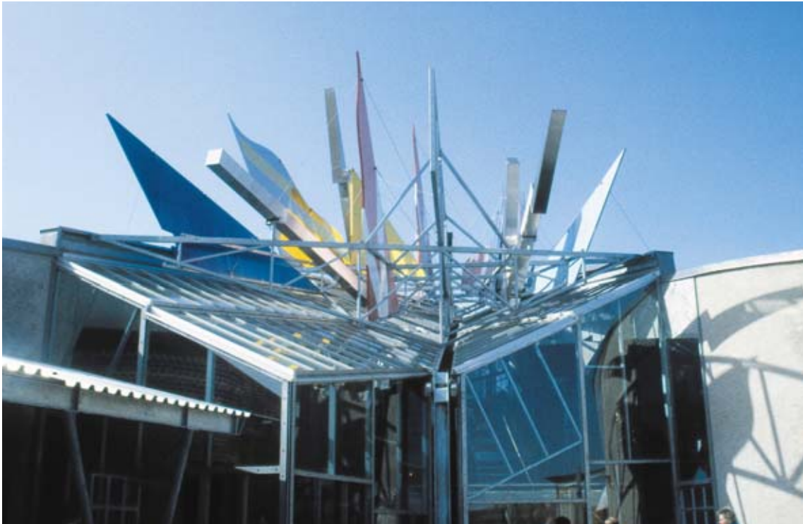
Historiecenter Dybbøl Banke.