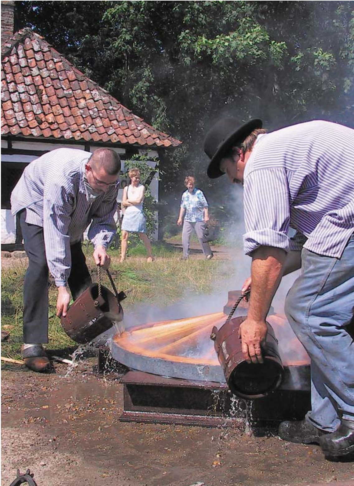
Hjerl Hedes Frilandsmuseum. Ringning af vognhjul ved smedien.