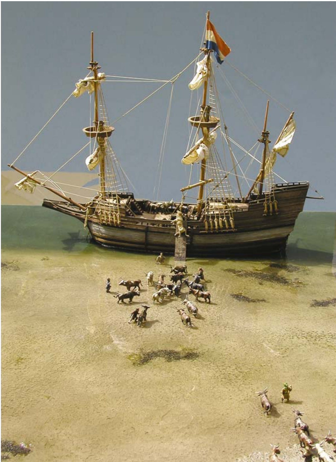
Vadehavscentret. Udslibning af okser fra Råhede vade.